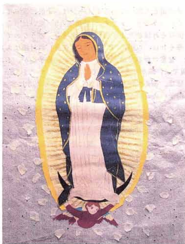
ゲアダルーベの聖母

命に通じる門はなんと狭く、その道も細いことか。それを見いだすものは少ない。(マタイ7・14)