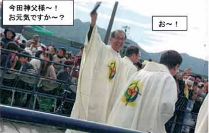
今田神父様～！ お元気ですか～？