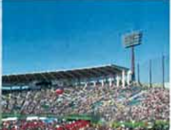
雲一つない青空へ