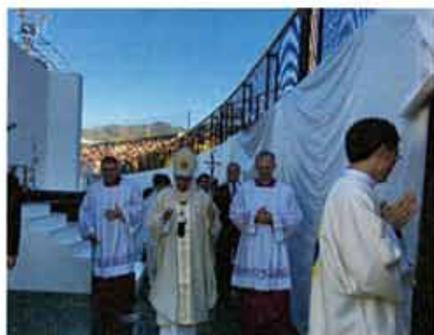
長崎ミサ終了 3 時過ぎ。広島へと向かわれました 雲一つない青空の中で...