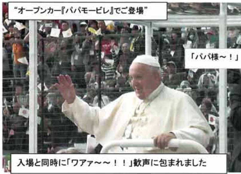
“オープンカー『パパモービル』でご登場”