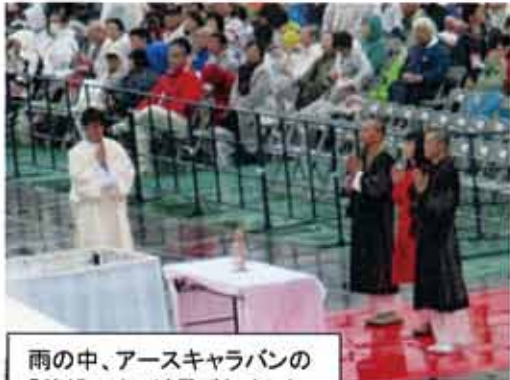
雨の中、アースキャラバンの「希望の火」が運ばれました