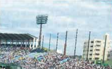
ミサ開始時間が迫る頃 青空がのぞき始めました