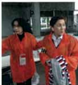
笹丘からもスタッフとして前日から泊まりがけで当日早朝から働きました 幸せでした