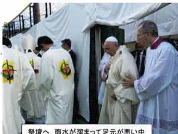
祭壇へ 雨水が溜まって足元が悪い中 ゆっくりと歩かれました