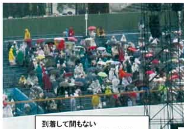
到着して間もないスタンド席の笹丘教会の仲間