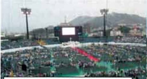
会場に到着時、雨が降り続いていました 10時半頃です 会場はびしょ濡れ

来日にあたって最高レベルのセキュリティが施され、3 万人以上の人々で埋め尽くされた長崎県営野球場は、カトリックのミサにもかかわらず、警官が見守る中で取り組まれました。当日の朝は雷雨を伴う雨。教皇様は長崎爆心地での式典、二十六聖人殉教地訪問、雨の中で平和のみ言葉を発信されました。その後雨が上がり、雲が減り・・・ミサが始まる午後には青空が見えてきました。それから、ミサが進むにつれて雲一つない日差し強い空模様。予報では当てはまらなかったこの天気の移り変わりに信者一同奇跡を感じ、この信仰を誇るべきものと確信したことでしょう。